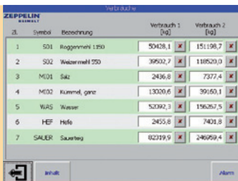
Monats- und Quartalsverbräuche