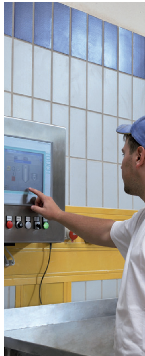
MINT 99 im Einsatz

Zeppelin Reimelt bietet für das Bäckerhandwerk, den Mittelstand und die Industrie Steuerungstechnik ganz nach Bedarf: von der einfachen Verwiegung bis zur vollautomatisierten Produktion mit Web-Technologie. Die einzelnen Systeme können jederzeit auf- und nachgerüstet werden und sind miteinander kombinierbar – für die individuelle Konfiguration Ihrer Betriebsabläufe. Und weil die Software auch nach vielen Jahren noch von unserem Team gewartet wird, genießen Sie ein hohes Maß an Investitionssicherheit.